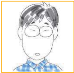
<奥様による肖像画>

トーダイ 先生 東京大学 文化一類 卒業 55歳 2児の父 もともとはいちゼミ塾生のお父さん。 いちゼミ講師として子どもたちに夢 を与えたいという気持ちがやまず 現在は、土曜日の質問箱で活躍して もらっています。