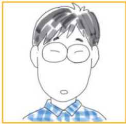
<奥様による肖像画>

トーダイ 先生 東京大学 文化一類 卒業 55歳 2児の父 もともとはいちゼミ塾生のお父さん。 いちゼミ講師として子どもたちに夢 を与えたいという気持ちがやまず 現在は、土曜日の質問箱で活躍して もらっています。